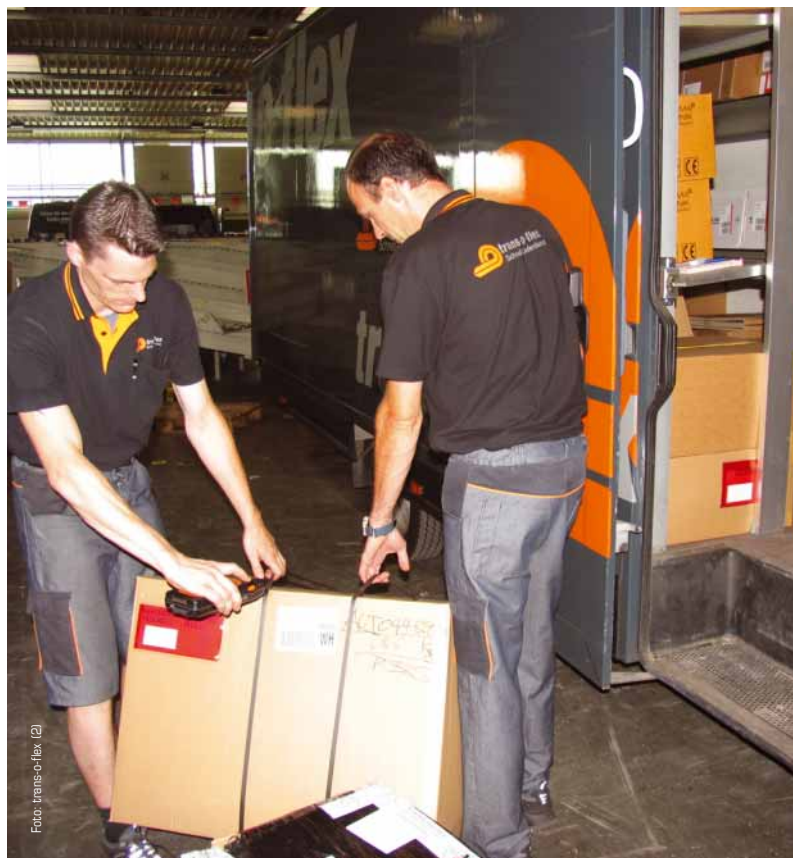
Die Frachtführer von trans-o-flex können durch die Anschaffung von Erdgasfahrzeugen wirtschaftlicher und umweltschonender fahren.

Die trans-o-flex Schnell-Liefersdienst GmbH hat im Frühjahr 2005 die ersten 15 Erdgasfahrzeuge vom Typ Iveco Daily 50 C 11 G bei ihrem Frachtführer Berdermann Transport GmbH in Krefeld offiziell in Betrieb genommen. Sie sind Teil einer größeren Bestellung von bis zu 100 Fahrzeugen, die die Frachtführer an verschiedenen Standorten einsetzen werden. Die Erdgasfahrzeuge bedeuten wegen ihres geringeren Schadstoffausstoßes eine erhebliche Umweltentlastung. Die Fahrzeuge stoßen weniger Kohlendioxid aus und der Ausstoß von Schwefeldioxid, Kohlenmonoxid, Ruß- und anderen Partikeln wird bei Erdgas nahezu vollständig vermieden. „Als Dienstleistungsunternehmen, das mehr als die Hälfte seines Umsatzes im Gesundheitsmarkt mit der regelmäßigen