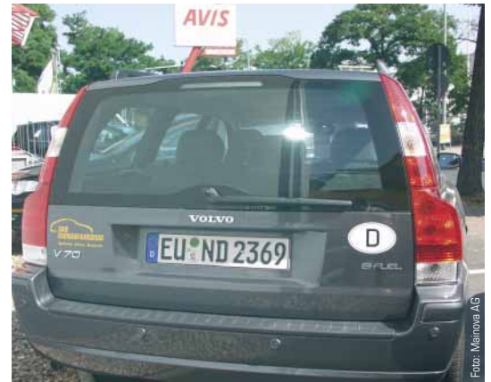
Avis-Kunden können künftig auch erdgasbetriebene Volvo V70 Bi-Fuel mieten.