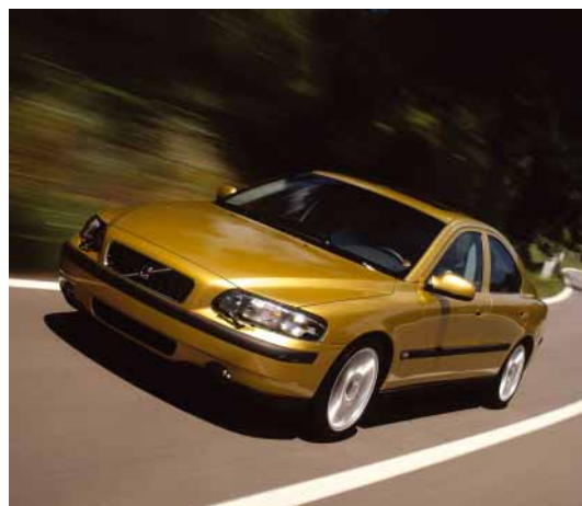
Bei den Fahrzeugvollkosten haben die Benzin- und Dieselfahrzeuge das Nachsehen gegenüber dem Volvo S60 Bi-Fuel.

Energieversorger dieses Einsparpotenzial, so entdecken zunehmend mehr Unternehmen Erdgasfahrzeuge als ein effizientes Mittel zur Kostenreduktion – gerade im Flottenbereich. Auch für Leasinggesellschaften zählen sie zunehmend zu einem attraktiven